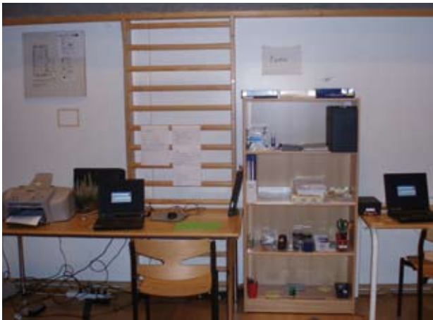
Langagerskolens gymnastiksal er indrettet med kontor og butik

der er tænkt på én, flytter folk – det gælder også disse unge mennesker. De unge giver meget fra sig og lærer kursUSDeltagerne, hvorfor det ene eller det andet er vigtigt for dem. Hvordan opgaven skal indlæres, hvor detaljeret man har brug for sin instruktion skal være, hvordan de opfatter det sagte konkret og derfor måske ikke forstår instruktionen, hvor observanderne skal stå, så den unge ikke bliver angst osv. Vigtige informationer for at udarbejde de støttesystemer, der skal til, så det kan lykkes for dem at fastholde et arbejde eller forblive i uddannelse.