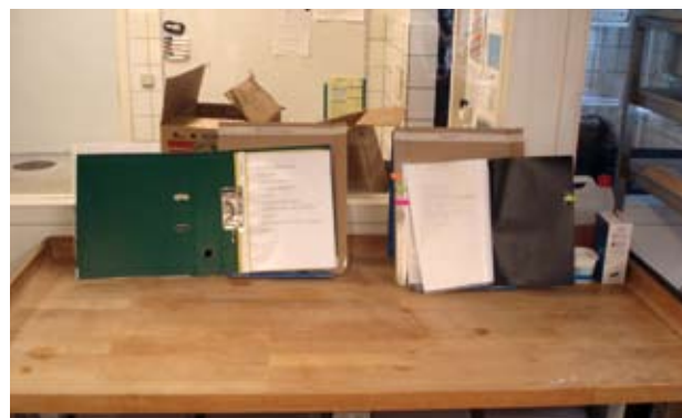
Eksempler på støttesystemer